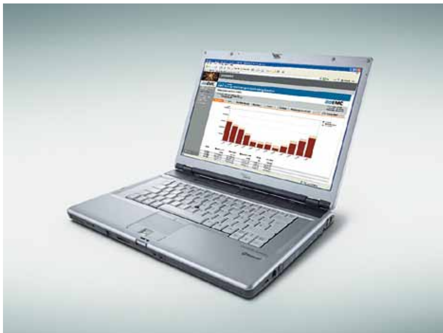
Mit EMC – Energy Monitoring & Controlling haben Sie Ihre Energiedaten im Griff.

Vorbei sind die Zeiten, als die Energierechnung aus der Portokasse gezahlt wurde. Wer sich heute mit dem Thema Energieeffizienz beschäftigt, der merkt schnell, dass ihm ein Messkonzept und klare Ziele gut anstehen würden.