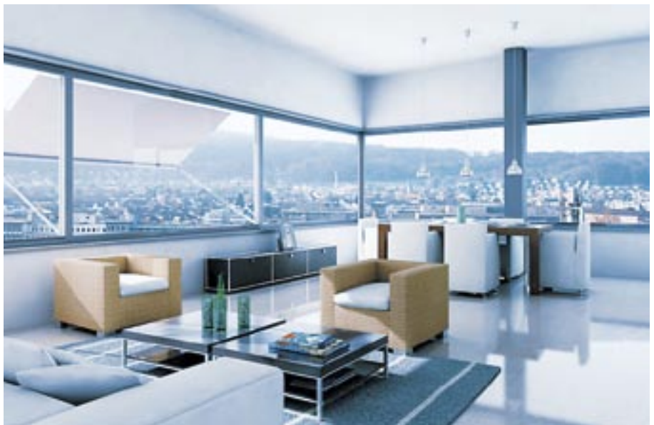
Im Gebäudeinnern erkennen Präsenzmelder mit integriertem Tageslichtsensor die Belegung der Räume und die Intensität des einfallenden Lichtes.

Entscheidend für die Einteilung in die Effizienzklasse A ist nebst der bedarfsabhängigen Steuerung und Regulierung auch die systemübergreifende Kommunikation. Mit einem durchgängigen Gebäudeleitsystem wird diese Vorgabe einfach und kostengünstig erreicht. Ersparnisse von rund 30% thermischer und 13% elektrischer Energie im Vergleich zur Effizienzklasse C sind die angenehme Folge.