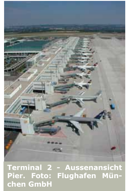
Terminal 2 - Aussenansicht Pier.

Die Überwachung der LON-Ringe erfolgt durch spezielle Router, die sowohl eine Leitungsunterbrechung als auch den Ort der Unterbrechung detektieren und