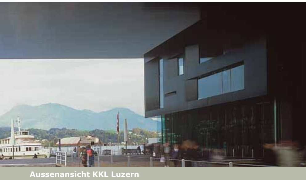
Aussenansicht KKL Luzern