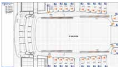
Gebäudeplan pro Balkon

Der Leitreechner ist als redundantes 2 Computer-system ausgebildet, welche abwechselungsweise verwendet werden. Die Leitreechner verbinden sich mit dem LON System über Ethernet IP-852. Die neue Softwarelösung bildet die Antriebe für Echokammer, Textilbahnhof und Textilien einheitlich über einen OPC Server auf der Leitstation ab. Die Leitstation (OPC Client) sieht diese wie eine Achsensteuerung der übrigen Bereiche der Ober- und Unterbühne.