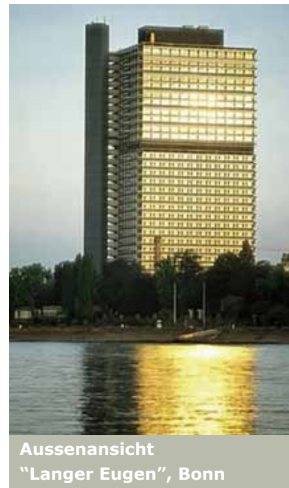
Aussenansicht „Langer Eugen“, Bonn

Eine weitere Besonderheit in diesem Gebäude bilden die grossen Konferenzsäle mit den Dolmetscher-Kabinen. Hier ist die Mediensteuerung mit der Steuerung für Licht und Jalousien gekoppelt. Die Grundbedienfunktionen der Lichtsteuerung erfolgt über Bediengeräte an den Eingangstüren. Die Verwendung des DALI Lichtbussystems ermöglicht die effiziente und individuelle Steuerung der Beleuchtung in den Konferenzsälen. Mittels Mediensteuerung kann der Vortragende verschiedenste Lichtszenarien steuern sowie Audio-Einstellungen vornehmen. Diesbezüglich logische Steuerverknüpfungen als auch die Temperaturregelung erfolgen über den programmierbaren