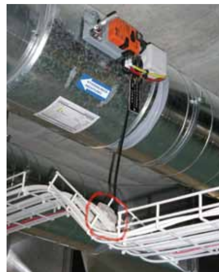
Erschliessung der Volumenstromregler mittels Woertz multibus Kabel

Die Realisation der HLK-GA verlief in allen Phasen ohne nennenswerte Probleme. Sie konnte innerhalb des budgetierten Kostenrahmens realisiert und termingerecht der Bauherrschaft übergeben werden.