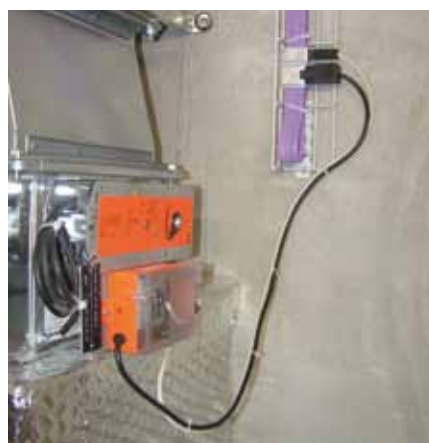
Anschluss der kommunikativen Brandschutzklappenantriebe mit Woertz Flachbandkabel 230V und LON-Bus in einem Kabel.

Als Herausforderung erwies sich der Anschluss des MP-BUS an die Controller des Steuerungssystems von Honeywell. Da dieses nicht auf offenen Programmierschnittstellen basiert und von aussen nur über einen LON-BUS adressierbar ist, mussten Gateways als Brücken vom MP- zum LON-BUS eingesetzt werden. Die Wahl fiel auf das Modell UK24-LON von Belimo.