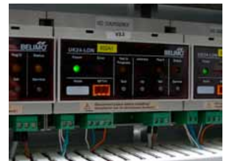
UK24LON-Geräte in der Lüftungszentrale, welche die Volumenstromregler mit MP-Bus und LON verbinden. (Quelle BUS-HOUSE).

Über LON FTT 10 und Loytec-Router werden mit Honeywell Kühldeckenregler einerseits die Ventile der Kühldecken geregelt. Die eingesetzten W7763 Kühldeckenregler entsprechen dem LonMark Funktionsprofil #8020 «Fan Coil Unit Controller», Version 2.0. Andererseits gibt der Temperaturregler den VAV Compactreglern NMV-D2M von Belimo, welche jederzeit das gewünschte Volumen zur Verfügung stellen, via MP/LonWorks Gateway