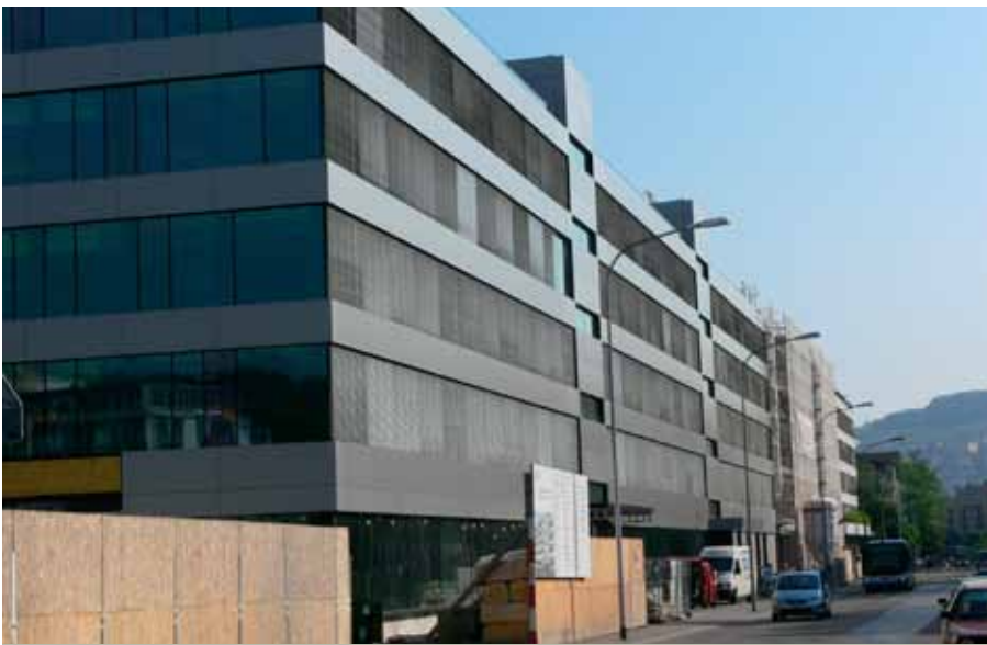
Der Gebäudekomplex UBS Flurhof in Zürich Altstetten.

In der laufenden Sanierung des Gebäudekomplexes UBS Flurhof in Zürich Altstetten werden Komponenten von Belimo nebst denjenigen des Systemlieferanten Honeywell auf der Basis von LonMark® interoperabel eingesetzt. Dadurch wird die Funktionalität und Sicherheit gesteigert, und der Komfort bei rationellerem Betrieb erhöht.